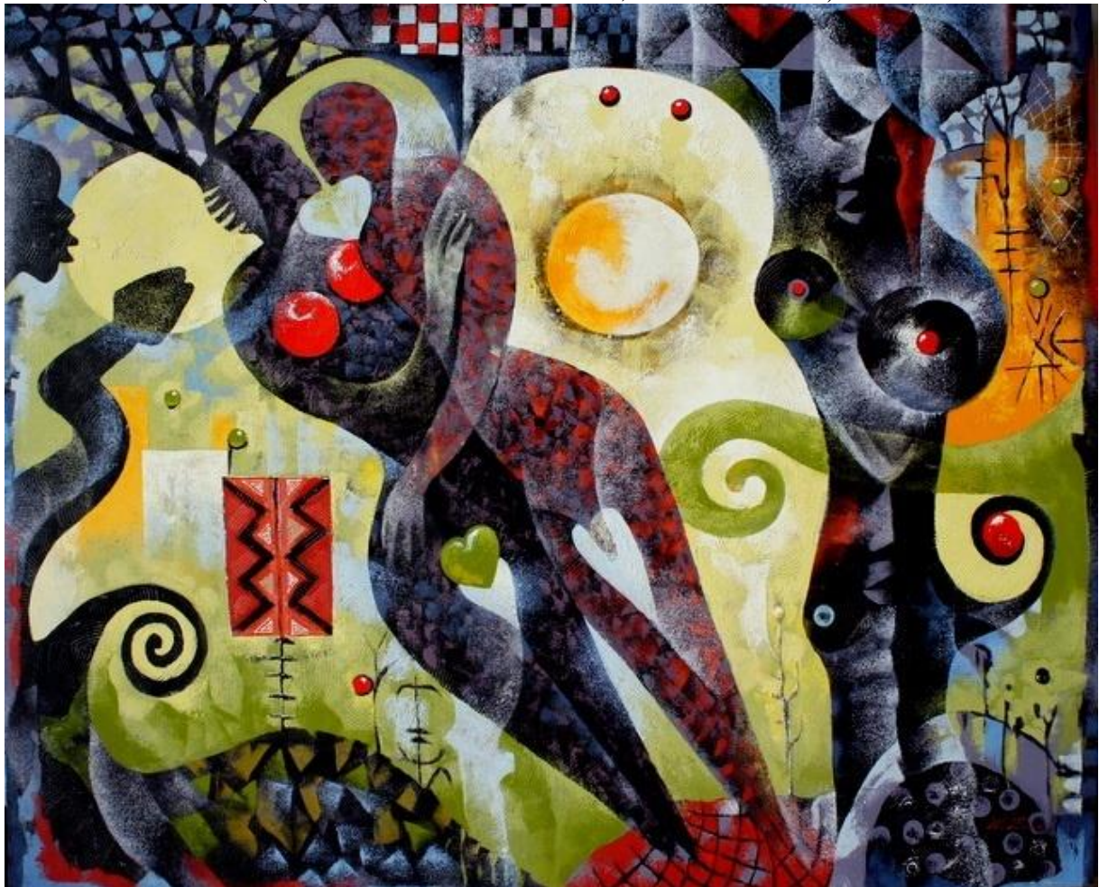
Hommage à Njéjib Belkhdja pour la 10 e année de sa mort

organisent le Deuxième Congrès Mondial de Brachylogie – CMB2 : La Nouvelle Brachylogie à la croisée des sciences et des cultures (Mouradi Hammamet - Tunisie, 12-15 avril 2017)